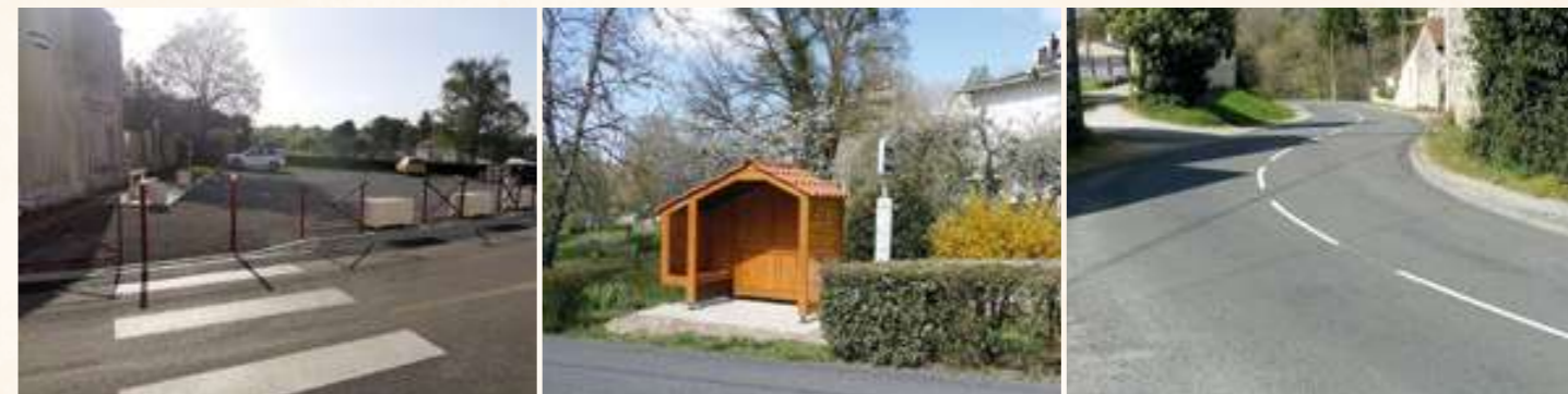
Aménagement place des Rampeaux et route de Font Toussaint

Dans la mesure du possible, nos agents ont tenté, lors du fauchage de printemps, de tenir compte des demandes de plusieurs Diracois quant au respect d'espèces préservées. L'an prochain, nous travaillerons de concert avec les Diracois qui le souhaitent pour tendre vers un fauchage plus raisonné.