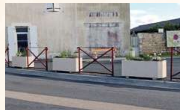
La place des Rampeaux avec ses jardinières fleuries