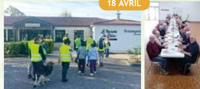
Les équipes à l'oeuvre et à table