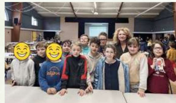
Les jeunes joueurs d'échecs de l'école

Encore un succès pour le loto de l'école ! Une fois de plus, l'événement a fait salle comble avec plus de 150 participants venus tenter leur chance dans une ambiance conviviale et pleine de bonne humeur. L'APE se réjouit de cette belle mobilisation et des bénéfices récoltés, qui permettront de financer de futurs projets pour les élèves. Elle espère que de nouveaux parents bénévoles auront à cœur de poursuivre ces actions en faveur de l'école et des enfants.