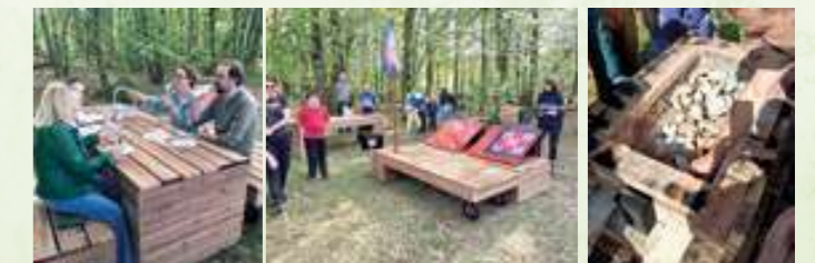
Les trimbalés : mobilier urbain

L'école d'art d'Angoulême, dans ses Ateliers de Dirac, n'a pas le temps de se reposer ; à peine un projet terminé que le suivant est déjà bien entamé. Après la réalisation des "Trimbalés", mobilier urbain déplaçable imaginé par la designer Camille Morin avec la participation de volontaires diracais, c'est à la fabrication d'instruments de musique en terre cuite qu'ils se sont attelés. Réalisés à partir de terre locale, les instruments ont été cuits dans un four construit pour l'occasion. Ils ont été présentés lors d'un événement ouvert au public le 27 mai à 17h30.