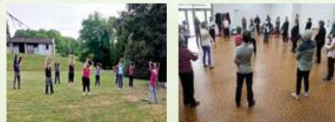
Pratique de Qi Gong en extérieur et en salle

Pour tout renseignement, contactez-nous par mail à : diracdaoyin@mailo.com