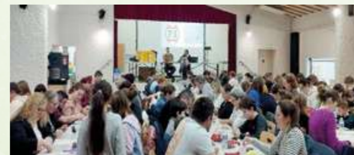
Le loto des parents d'élèves