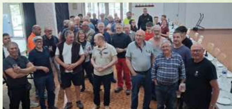
Les volontaires du nettoyage de printemps

La vie associative de notre commune est importante et permet de maintenir le lien social entre ses habitants. La nouvelle municipalité aura à cœur de continuer à soutenir toutes les associations diracoises, autant matériellement que financièrement. Le 18 mai dernier, un premier groupe de travail a réuni l'ensemble des représentants de toutes les associations diracoises et les élus de la commission pour organiser et améliorer la vie associative du village pour l'année à venir. Une réunion de ce type aura lieu chaque année à la même période.