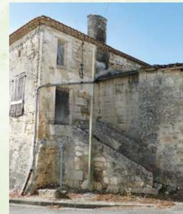
Bâtiment ancien place des Rampeaux

Sans oublier tous les autres projets qui seront mis en place progressivement sur les années à venir : aide à la personne, mobilité douce, aménagement de l'espace des commerces, bien-être des aînés, etc.