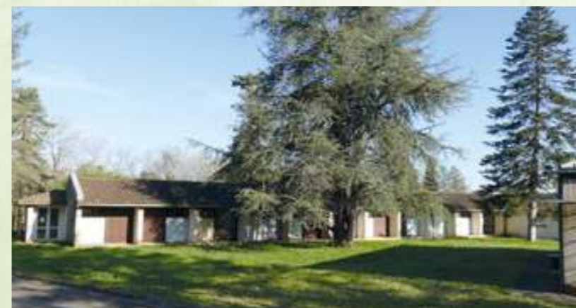
Ancienne maison de retraite

La commune de Dirac est propriétaire de plusieurs bâtiments inoccupés. Dans l'esprit du travail engagé avec le CAUE (Conseil d'Architecture, d'Urbanisme et de l'Environnement) lors du précédent mandat dans le cadre de la démarche Grand Village pour Demain, les travaux de réflexion seront poursuivis afin de redonner vie, le plus tôt possible à ces friches qui constituent un grand potentiel pour notre commune.