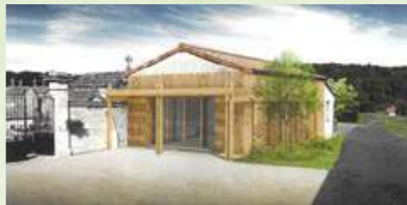
Vue d'architecte de la future maison des associations

À terme, la commune disposera d'une salle de 55 m 2 , pouvant recevoir jusqu'à une cinquantaine de personnes et entièrement accessible aux personnes à mobilité réduite.