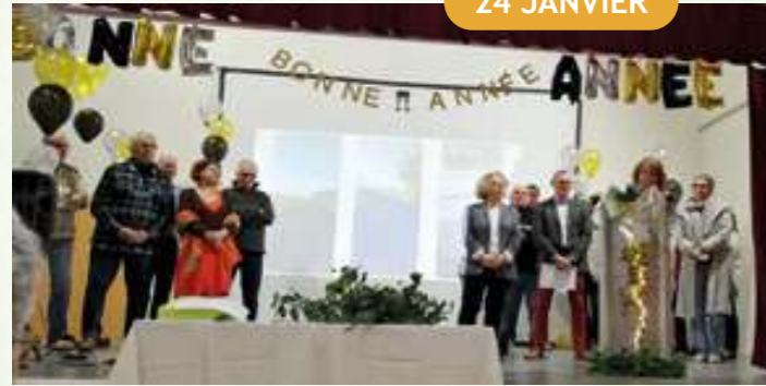
Les élus face aux Diracais