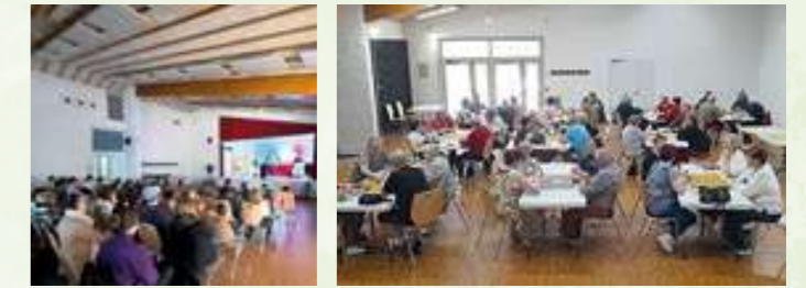
Le spectacle de Noël offert aux enfants de l'école et le concours de belote

Le 24 avril, notre concours de belote a réuni 20 équipes. Bravo aux gagnants et merci à tous les participants qui ont bénéficié d'un lot chacun.