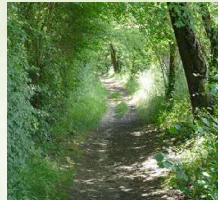
Carte des chemins ruraux de Dirac

Décidés par l'ancienne équipe, les travaux, financés en partie grâce au fond de concours « Patrimoine vernaculaire » de Grand'Angoulême, se porteront cette année sur la réfection des croix des Rampeaux, de Roprie et de la Reinerie.