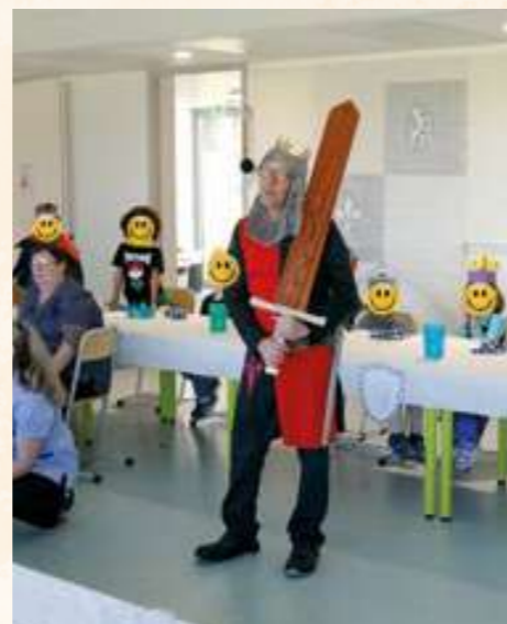
Notre chef cuisinier en tenue de chevalier et les élèves de CP fabriquant leurs épées avant le tournoi.