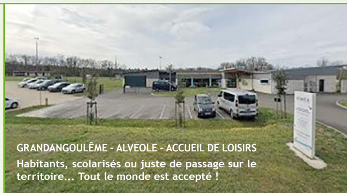
GRANDANGOULÊME - ALVEOLE - ACCUEIL DE LOISIRS Habitants, scolarisés ou juste de passage sur le territoire... Tout le monde est accepté !