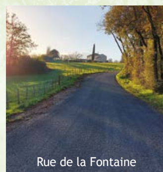
Rue de la Fontaine