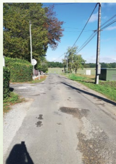
Route des Sablons