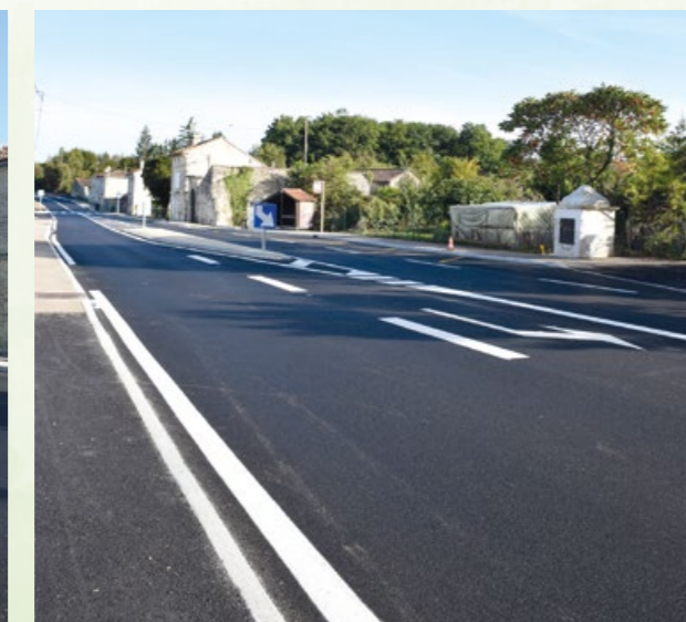
Traversée du Boisseau